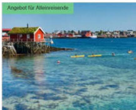
Angebot für Alleinreisende

MS OTTO SVERDRUP | 15 TAGE | 13. MAI 2022 - 15. SEP 2023