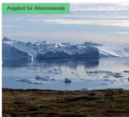
Angebot für Alleinreisende

MS NORDSTJERNEN | 6 TAGE | 15. MAI 2022 - 27. AUG 2023