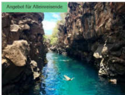
Angebot für Alleinreisende

Ob allein oder zu zweit: Auf ausgewählten Abfahrten unserer Expeditions-Seereisen zahlt jeder das Gleiche! Entscheiden Sie selbst, wie Sie am liebsten reisen, in jedem Fall entfällt bei Buchung einer Einzelkabine der Zuschlag! Dieses Angebot gilt für ausgewählte Abfahrten