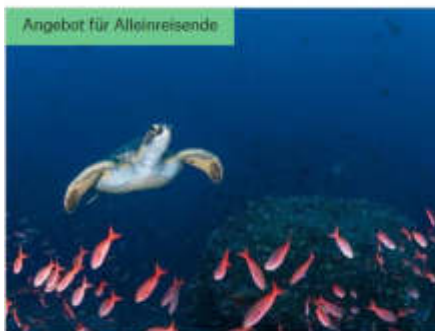
Angebot für Alleinreisende

MS SANTA CRUZ II | 11 TAGE | 10. MAI 2022 - 20. DEZ 2022