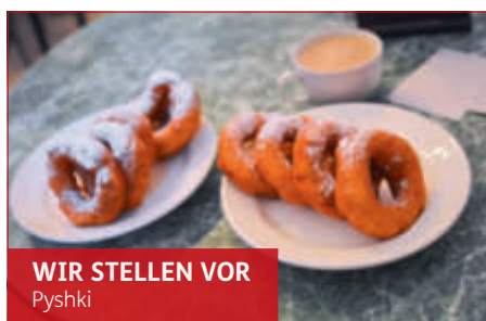
WIR STELLEN VOR Pyshki

Probieren Sie die allseits beliebten Pyshki, ein traditionelles, russisches „Streetfood“. Der rohe Teig wird, wie bei amerikanischen Donuts, zuerst frittiert und anschließend mit feinem Puderzucker bestäubt. Genießen Sie dazu eine heiße Tasse Tee oder einen Milchkaffee. In guter Gesellschaft und bei spannenden Gesprächsthemen schmecken die süßen Kringle gleich noch besser!